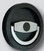
Doppelbart-Hochsicherheitsschloss EN 1300 Klasse A