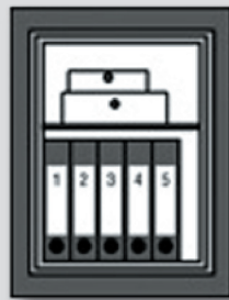
WT 10/6 350 WT 10/6 580