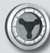
Mechanisches Zahlenkombinationsschloss EN 1300 Klasse A