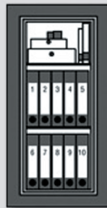
WT 10/8 350 WT 10/8 580