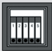
WT 10/5 350