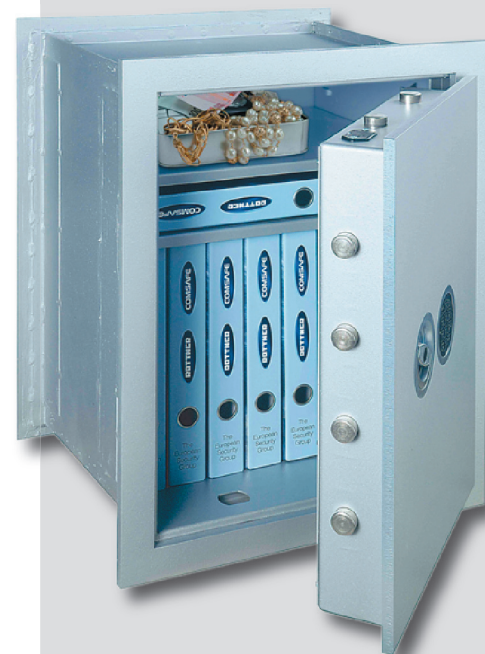
SE 65 Premium EL