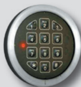
Elektronisches Sicherheitsschloss EN 1300 Klasse B