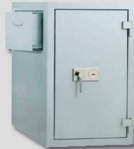
Modell Madrid Sonder

Weitere Sonderausstattungen auf Anfrage!