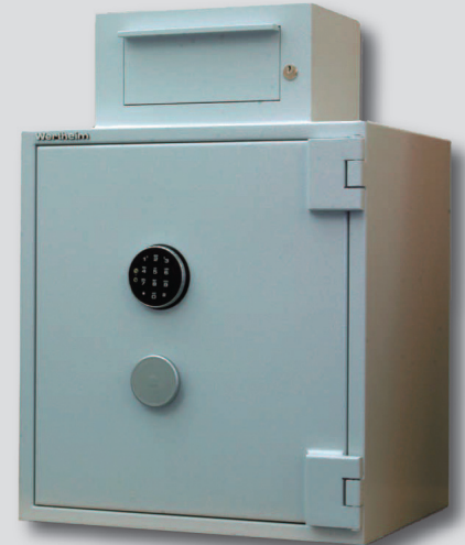
Beispiel: Einwurftresor AMT 0600