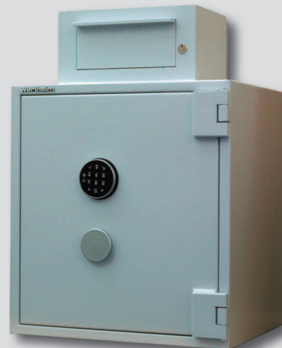
Beispiel: Einwurftresor AMT 0600