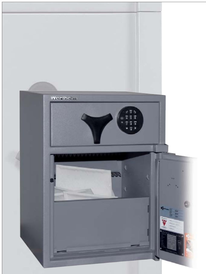
Abb. Deposit-Wertschutzschrank AG15DF - Lade vorne, K-Schloss Cawi 2 Schlüssel (95 mm), Ladensperre: E-Schloss M-Locks EM2020 Schwenkriegel, Option: 1 Rückhalteblech