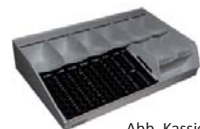
Abb. Kassiereinrichtung Inkiess 880PL

Die Kassiereinrichtung besteht aus: 8 Einzelmünzbehälter von 2 EURO bis 1 EURO-Cent, 8 Banknotenfächer und einem Rollenfach