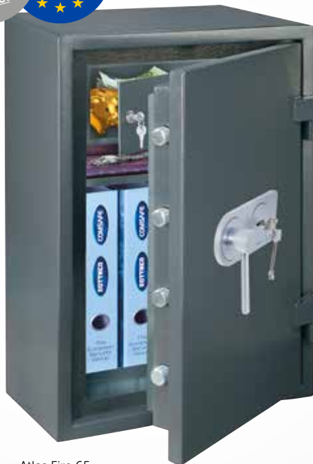
Atlas Fire 65