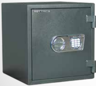
Atlas Fire 45