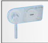
Handhebelgriff DB Standard-schloss

Feuerschutz 60 Minuten für Papier LFS-60 P