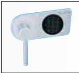
Handhebelgriff EL Sicherheits-schloss